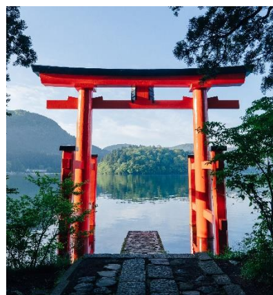
「箱根神社」バス停から徒歩3分の平和の鳥居